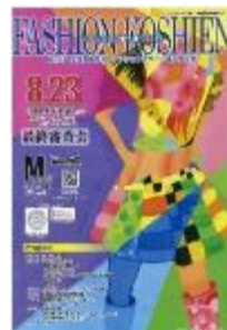
第15回大会 (平成27年度) 黒石商業高校 今井敦也