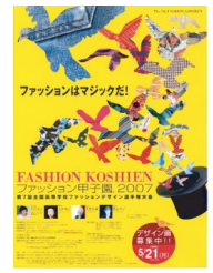
第7回大会 (平成19年度)