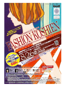
第12回大会 (平成24年度) 弘前実業高校 成田知恵