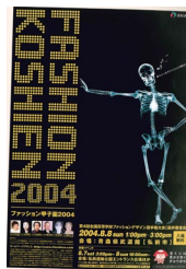
第4回大会 (平成16年度)