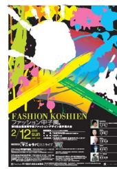
第5回大会 (平成17年度)