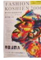
第6回大会 (平成18年度)