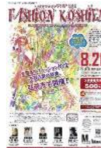
第16回大会 (平成28年度) 鱒ヶ沢高校 加藤星南