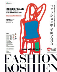
第3回大会 (平成15年度)