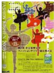
第8回大会 (平成20年度) 黒石商業高校 木村知里