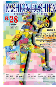
第11回大会 (平成23年度) 青森戸山高校 福士胡桃