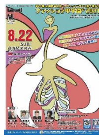
第 20 回大会 (令和 3 年度) 六甲アイランド高校 (兵庫県) 浦野菜々子