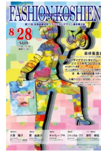
第11回大会 (平成23年度) 青森戸山高校 福士胡桃