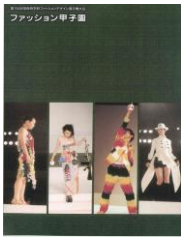
第1回大会 (平成13年度)