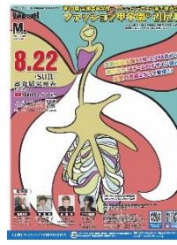
第 20 回大会 (令和 3 年度) 六甲アイランド高校 (兵庫県) 浦野菜々子