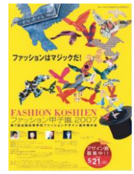
第7回大会 (平成19年度)