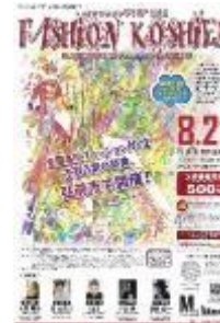
第16回大会 (平成28年度) 鱒ヶ沢高校 加藤星南