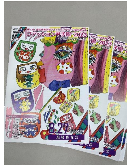
最終審査会プログラム