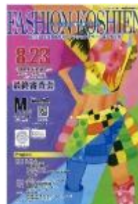
第15回大会 (平成27年度) 黒石商業高校 今井敦也