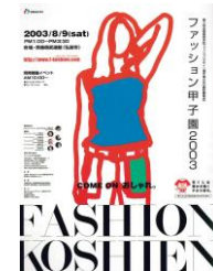
第3回大会 (平成15年度)