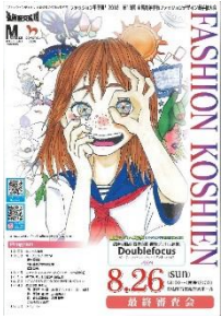
第 18 回大会 (平成 30 年度) 坂井高校 (福井県) 石田萌乃花