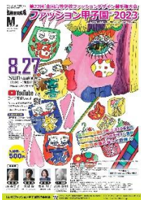
第 22 回大会 (令和 5 年度) 興陽高校 (岡山県) 篠原希光