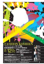
第5回大会 (平成17年度)