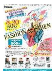
第17回大会 (平成29年度) 興陽高校(岡山県) 井上賀由里