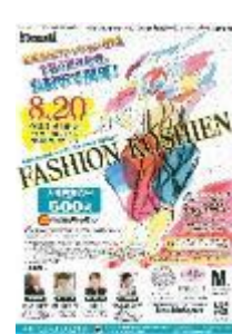
第17回大会 (平成29年度) 興陽高校(岡山県) 井上賀由里