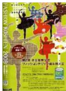
第8回大会 (平成20年度) 黒石商業高校 木村知里