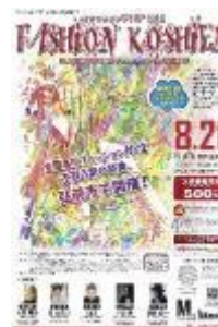
第16回大会 (平成28年度) 鱈ヶ沢高校 加藤星南