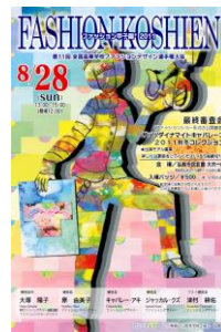
第11回大会 (平成23年度) 青森戸山高校 福士胡桃