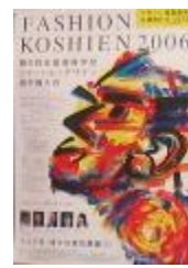
第6回大会 (平成18年度)