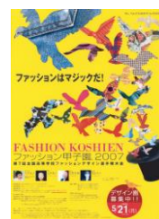
第7回大会 (平成19年度)