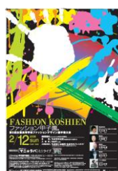
第5回大会 (平成17年度)