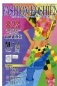
第15回大会 (平成27年度) 黒石商業高校 今井敦也