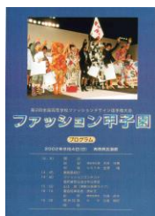
第2回大会 (平成14年度)