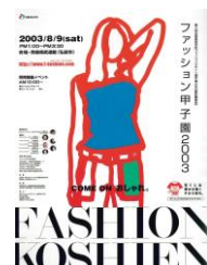
第3回大会 (平成15年度)