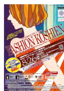
第12回大会 (平成24年度) 弘前実業高校 成田知恵