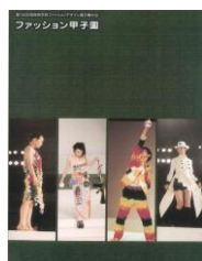
第1回大会 (平成13年度)